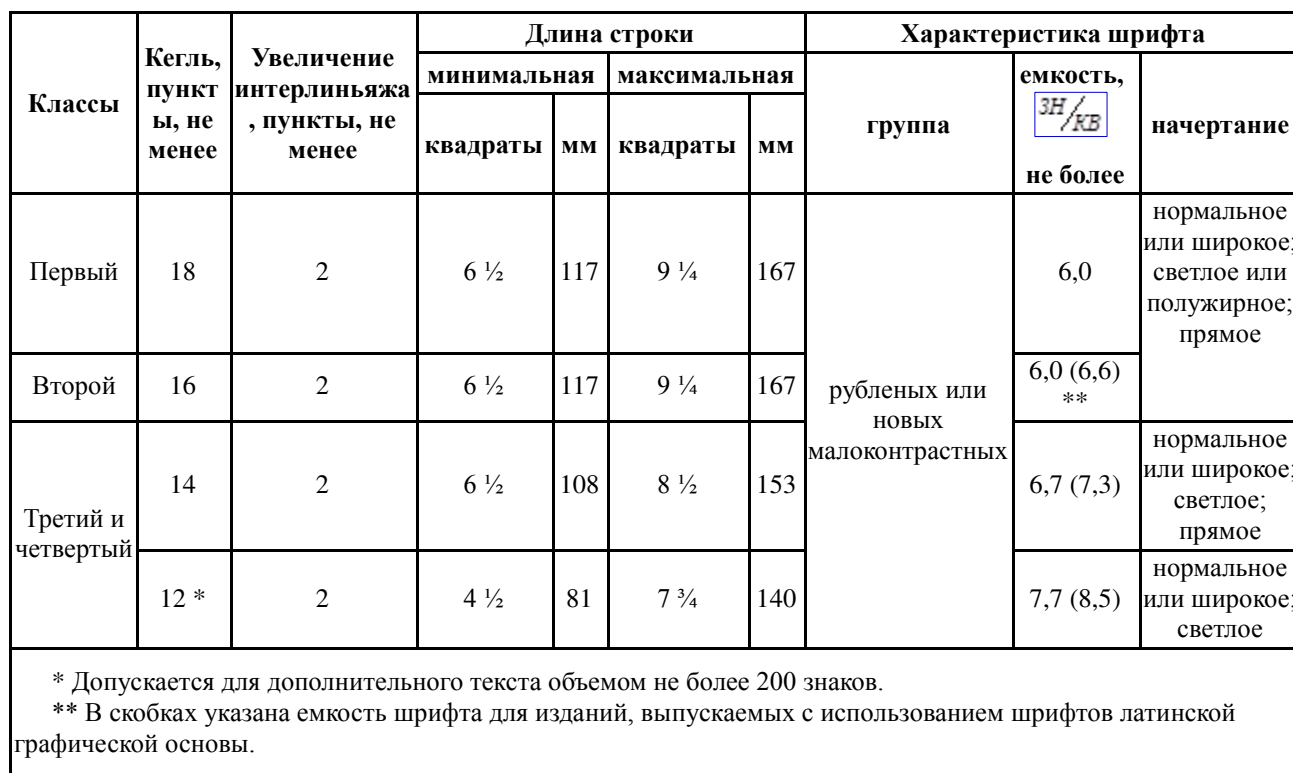
Требования к шрифтовому оформлению текста изданий по гуманитарным дисциплинам для 1 - 4 классов

3.2.2.2. Не допускается двухколонный набор основного и дополнительного текста, кроме стихов.