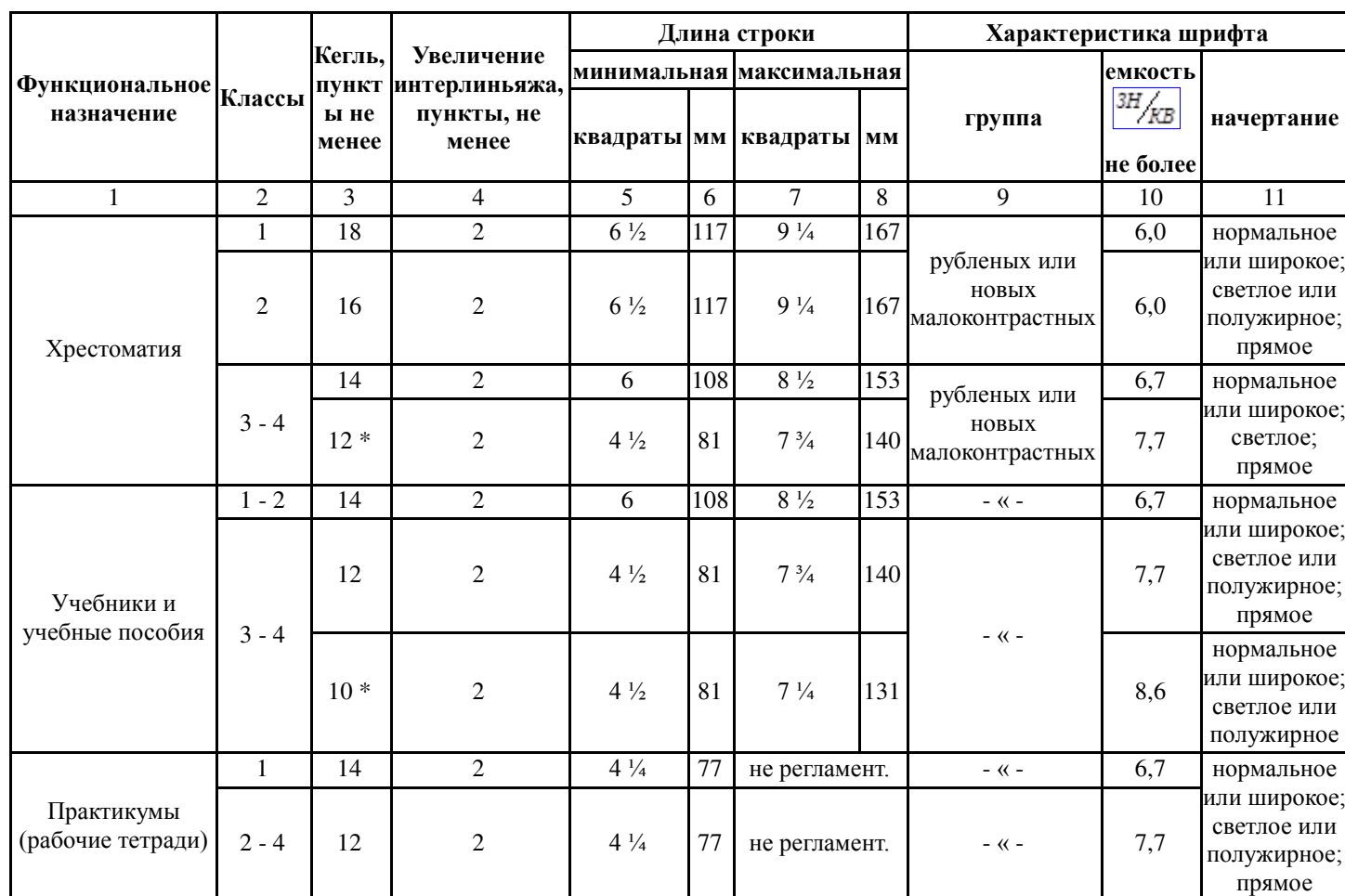
Требования к шрифтовому оформлению текста изданий по естественным дисциплинам для 1 - 4 классов